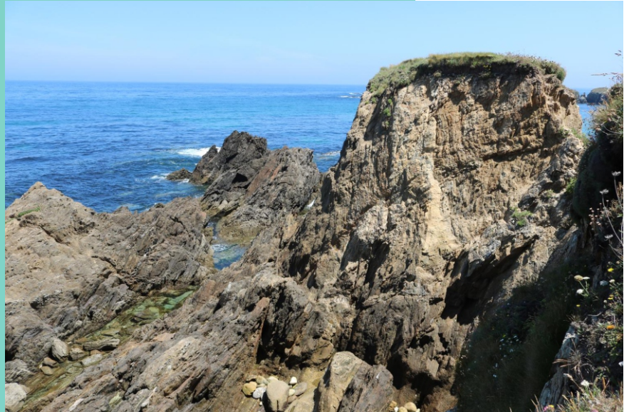
Punta da Ferreira ou de Santa Mariña, linde entre Carballo e Malpica