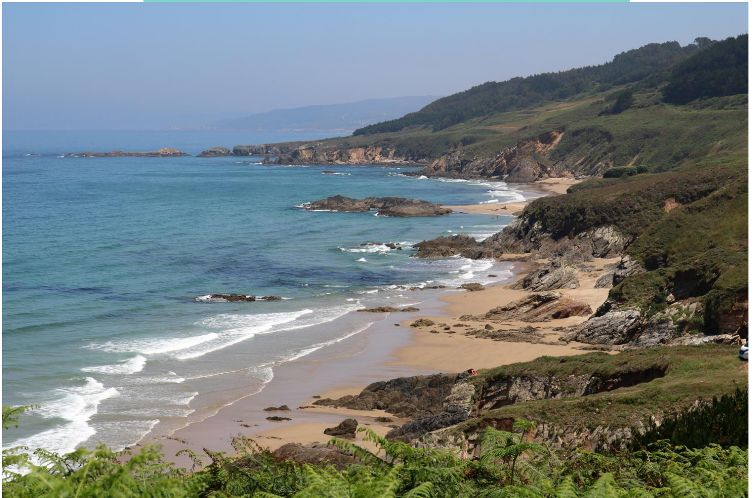
Vista desde a praia dos Riás ata a punta de Chan de Razo