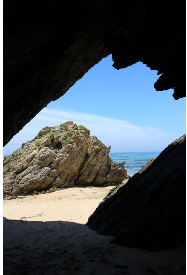
Furna na praia dos Riás

Un pequeno tramo da costa leste de Malpica que vai desde a praia dos Riás ata o linde con Carballo, na punta de Ferreira ou Santa Mariña, un espazo protexido dentro do LIC e ZEPA “Costa da Morte” pola importancia dos hábitos costeiros, da flora, da xeoloxía e da paisaxe.