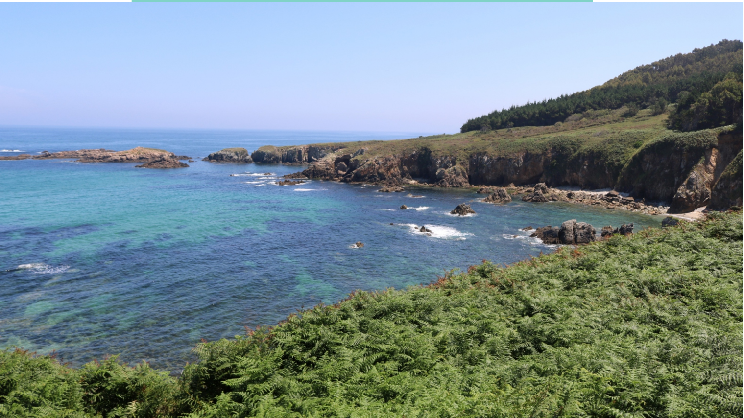
Vista desde a punta da Ferreira cara a ao seo das Uchas e a punta de Chan de Razo coas Percebeiras