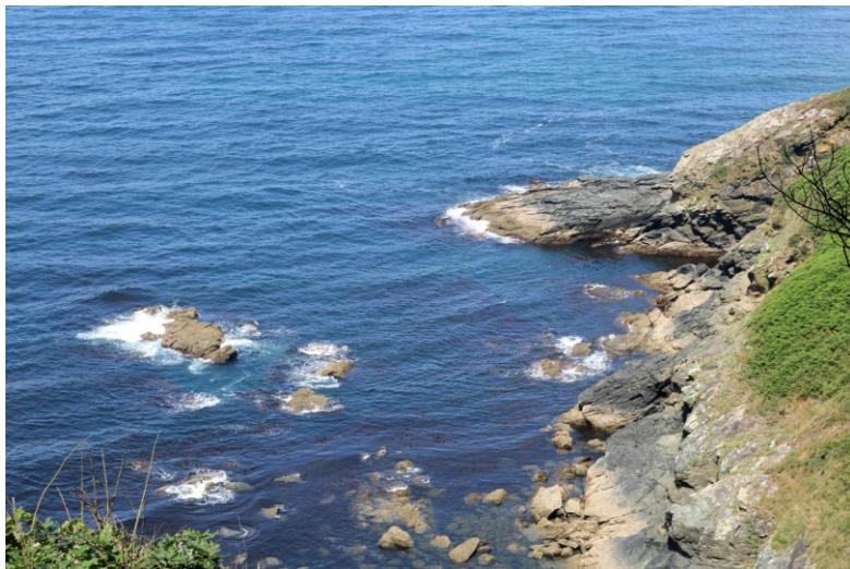
Punta do Cociñadoiro ou Pedras Negras

A pista de terra que segue desde San Miro lévanos ao Ceán desde onde se pode continuar ata Ardeleiro para ver os Muíños da Ribeira