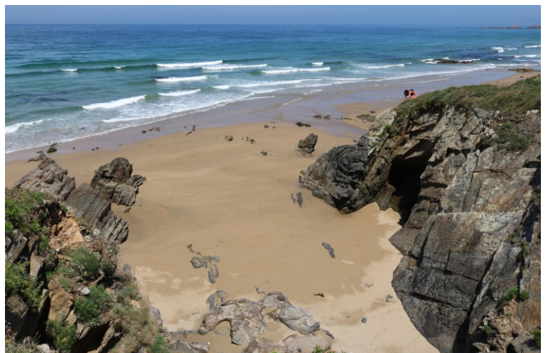
Praia dos Riás