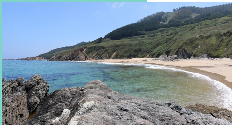
Praia das Torradas