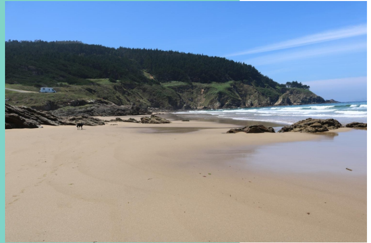
Praia dos Riás